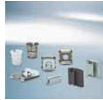
Schnellbefestiger und Clipse