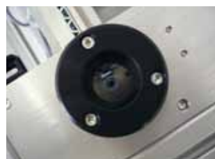
Nietübergabeeinheit, integriert oder extern