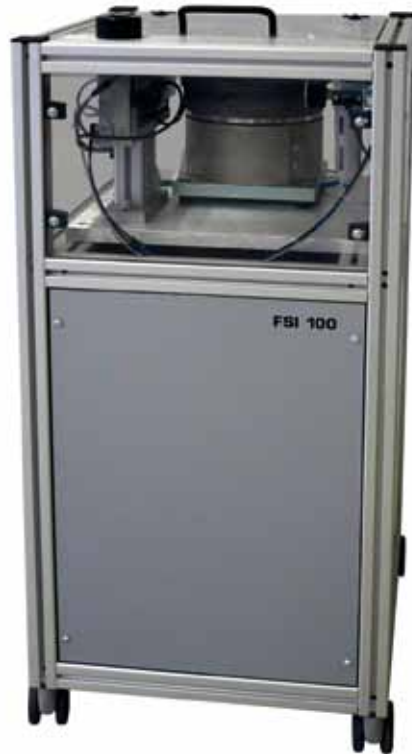
Nietspender FSI 100

Maße: 480 x 400 x 985 mm (B x T x H) feststellbare Lenkrollen