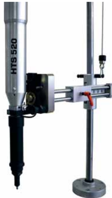
alte Magazinierungsposition und Nietposition