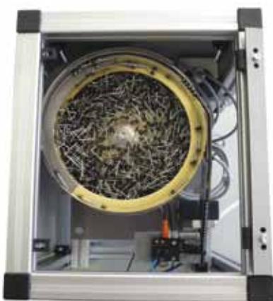
Schwingförderer für Sortierung und Vereinzlung