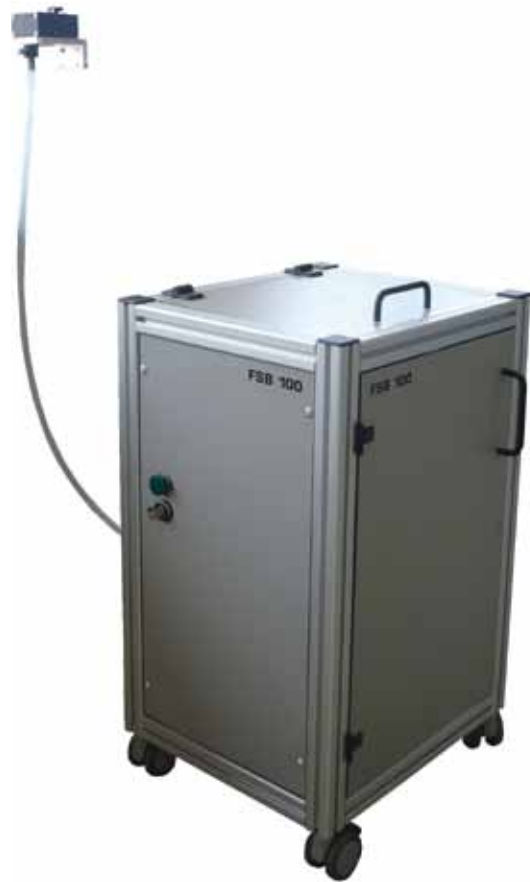
Nietspender FSB 100

Maße: 480 x 400 x 985 mm (B x T x H) feststellbare Lenkrollen