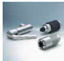
Schnelladapter und -kupplungen 4)