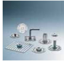
Befestigungselemente für Verbundwerkstoffe