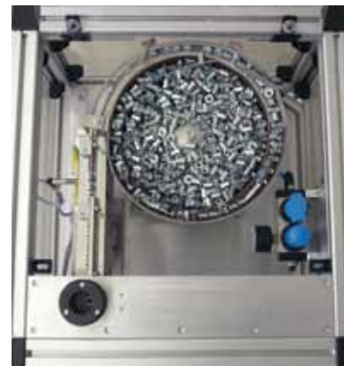
Schwingförderer für Sortierung und Vereinzelung