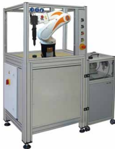
Roboterzelle RRB 500 mit Stabnietgerät HTB 500 und Nietspender FSB 100