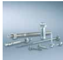
Befestigungstechnik Bau 2)